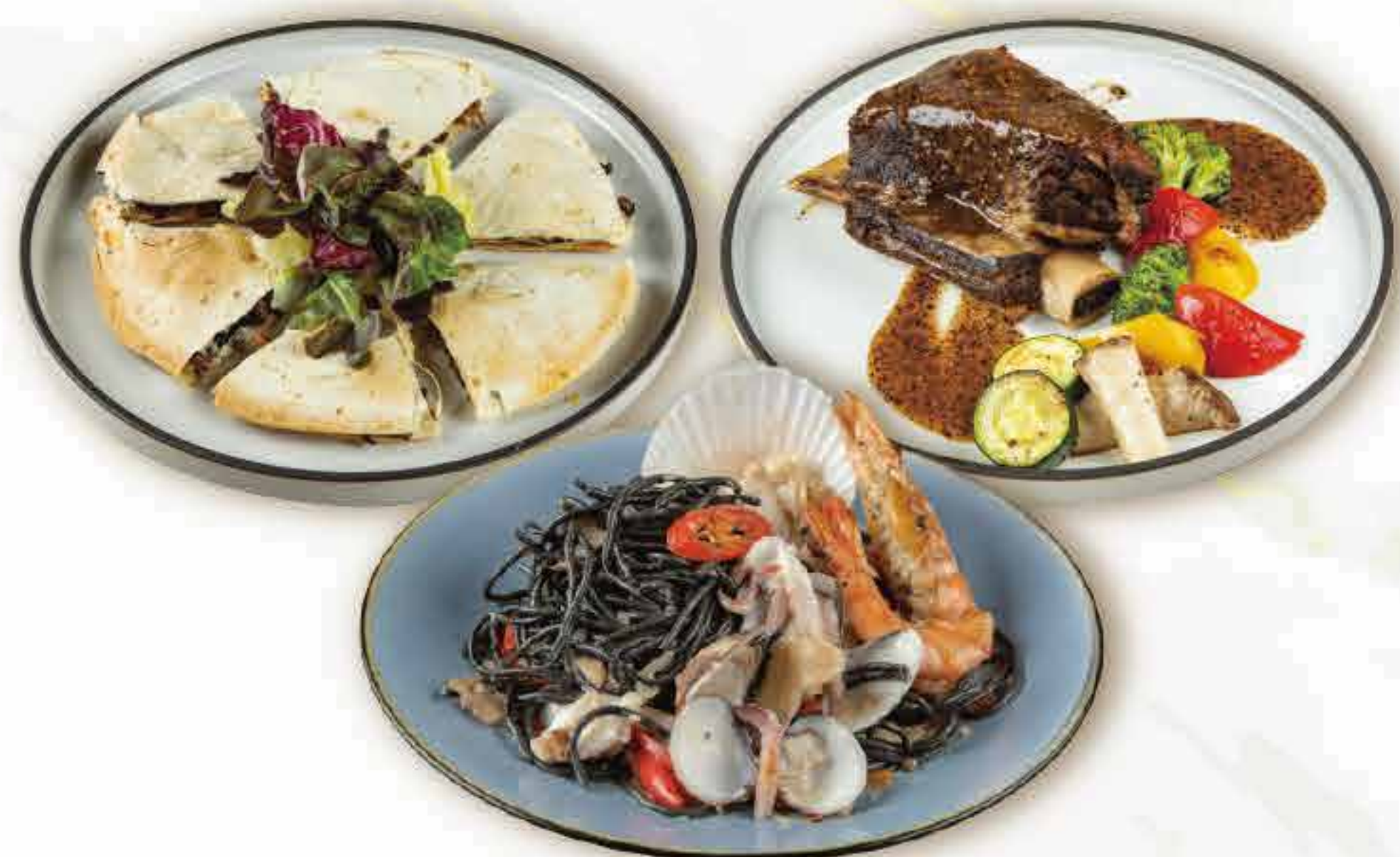
蒜味海鮮墨魚義大利麵 Spicy Seafood Garlic Pasta